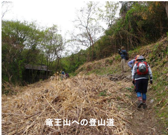
竜王山への登山道

切。途中から直登気味になります。山頂手前に展望が開けた場所に丸太木のベンチがあり讃岐富士が見えました。また、ツタのからんだ巨木があります。山頂には40分足らずで到着、展望はなく小さな木札が山頂を示しています。集合写真を撮り下山する。山頂で雨粒が