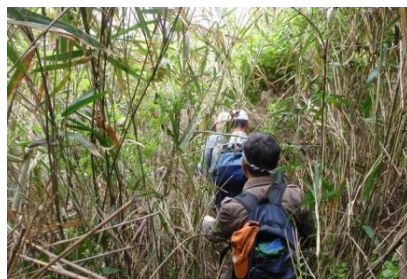
癖になるヤブコギ？

9:30の佐柳島行きの船が来るまで自由行動にしましたが行くところもなく、待合室で地元の方と世間話で時間をつぶす。