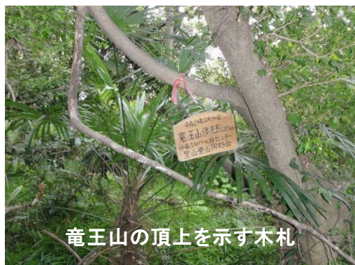
竜王山の頂上を示す木札