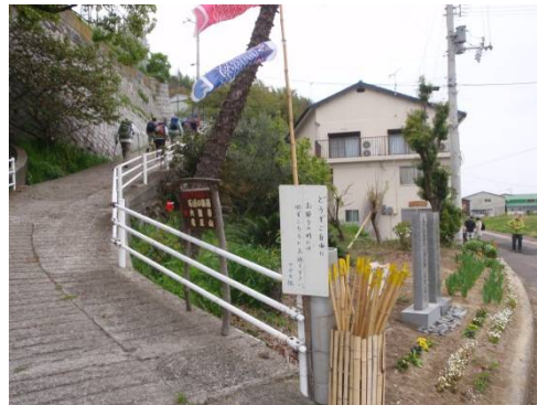
登り口に杖が置いてありました

竜王山への登山口は、最初は細いコンクリートの道、石段など民家の間を上ります。登山道はきれいに整備されていて案内板も新しく親